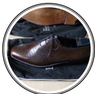
ТУФЛИ ИЗ КРОКОДИЛЬЕЙ КОЖИ BERLUTI — 70 тыс. рублей