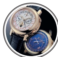
ЧАСЫ PATEK PHILIPPE – SKY MOON TOURBILLON — 55 037 500 рублей