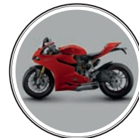
МОТОЦИКА DUCATI — 1 млн рублей