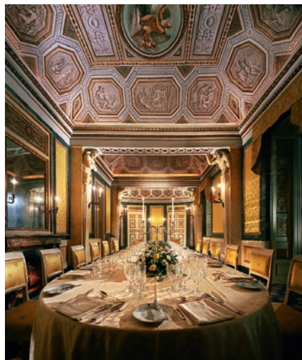
Интерьер Villa d'Este