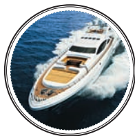
100-МЕТРОВАЯ ЯХТА MANGUSTA 165 — от 30 млн евро (без доставки и таможенной очистки)