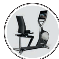
ТРЕНАЖЕР TECHNOGYM — 300 тыс. рублей