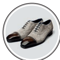
ОБУВЬ ANGELO GALASSO — от 2 до 250 тыс. евро