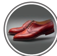
ТУФЛИ JOHN LOBB — 60 тыс. рублей