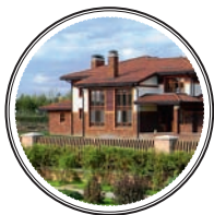
ДОМ В ПОДМОСКОВЬЕ: элитный поселок «Миллениум Парк», 400 метров и 20 соток — около 40 млн рублей