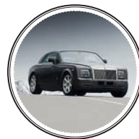
АВТОМОБИЛЬ ROLLS-ROYCE — около 17 млн рублей