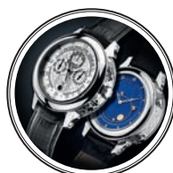
ЧАСЫ PATEK PHILIPPE – SKY MOON В ПЛАТИНЕ — 1,5 млн долларов