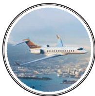
САМОЛЕТ BOMBARDIER GLOBAL 6000 — 45,5 млн долларов