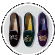
ЖЕНСКИЕ ТАПОЧКИ PENELOPE CHILVERS — 16 500 рублей