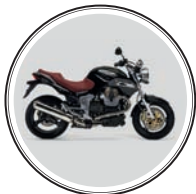
МОТОЦИКА МОТО GUZZI — 600 тыс. рублей