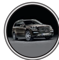
ВНЕДОРОЖНИК MERCEDES-BENZ GL-КЛАССА — около 4 млн рублей