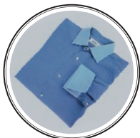
РУБАШКА BRIONI — около 25 тыс. рублей